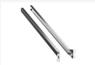
Anti-kantel roestvrijstalen rekgeleiders

NB: Geef de gewenste opties door op het moment van bestellen aub.