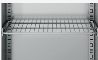
GN 2/1 nylon gecoat rek