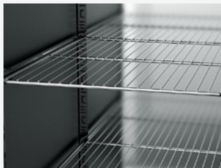
GN2/1 roestvrij stalen rek