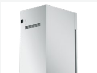
RVS achterkant voor eiland opstelling